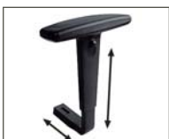
A-98 in Höhe und Breite verstellbar, Armleh- nenträger schwarz