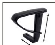
A-97 in Höhe und Breite verstellbar, Armleh- nenträger schwarz